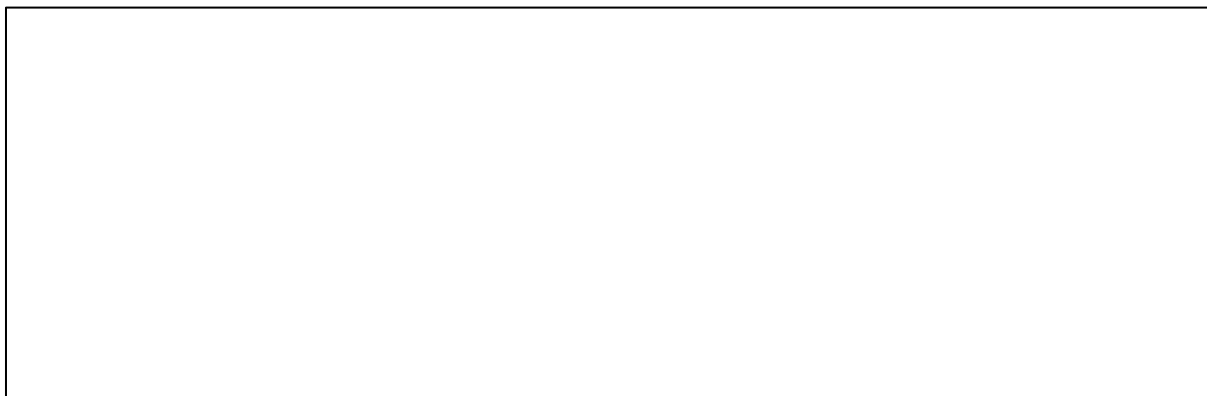
Figura 1 ou Tabela 1: Título da figura ou tabela.

Caso sejam utilizadas imagens ou tabelas no corpo do texto, trazê-las conforme o exemplo a seguir. Referenciar as figuras é obrigatório (Figura 1). Utilize figuras leves.